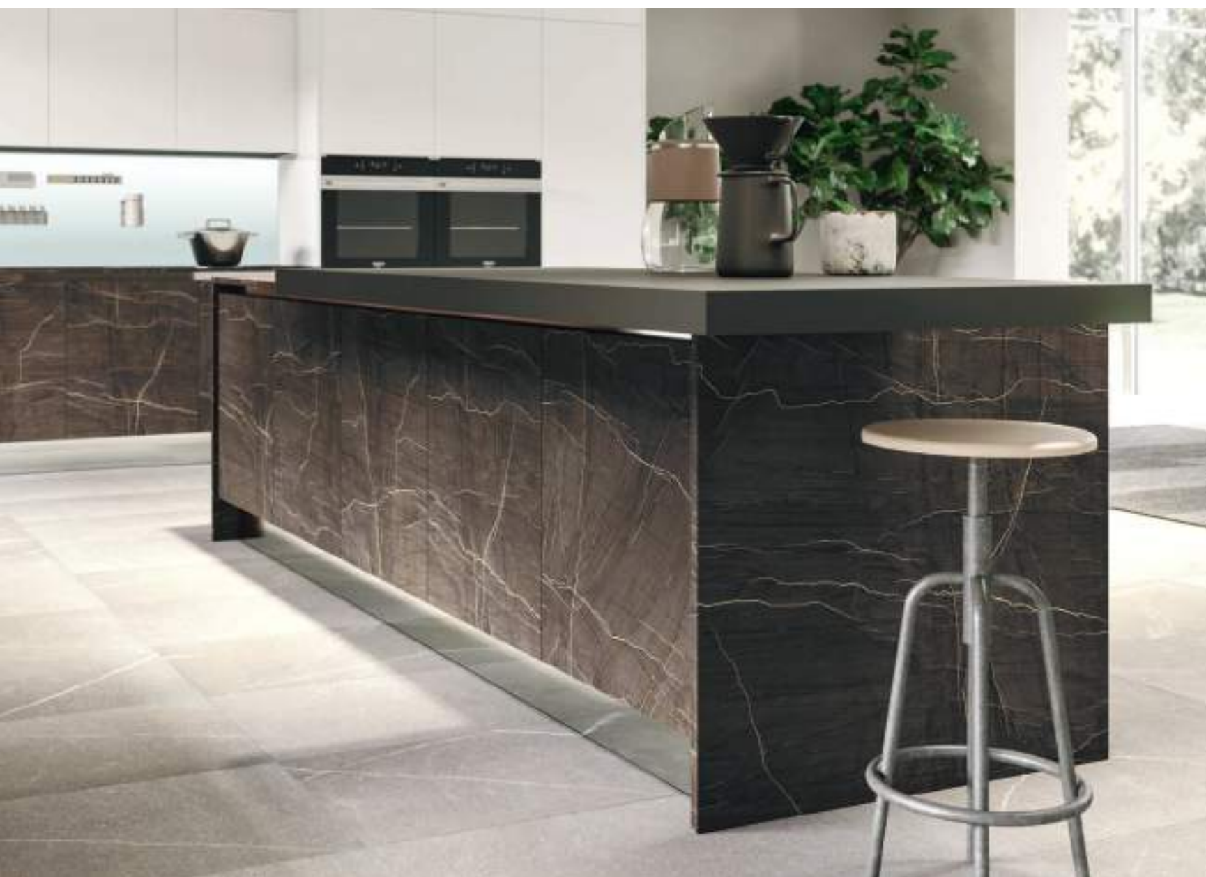
PIANO SNACK AGGETTANTE IN FENIX NTM GRIGIO BROMO.

PROTRUDING SNACK TOP IN FENIX NTM GRIGIO BROMO.