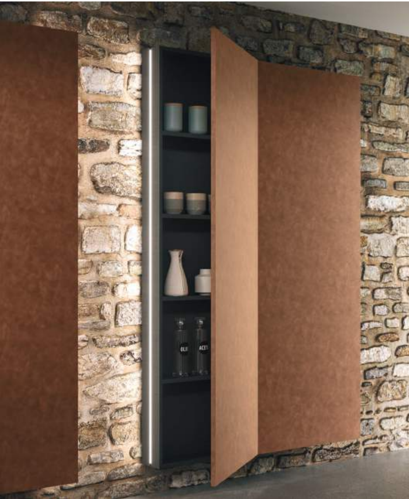
COLONNE E SCHIENALI BROWN LARCH.