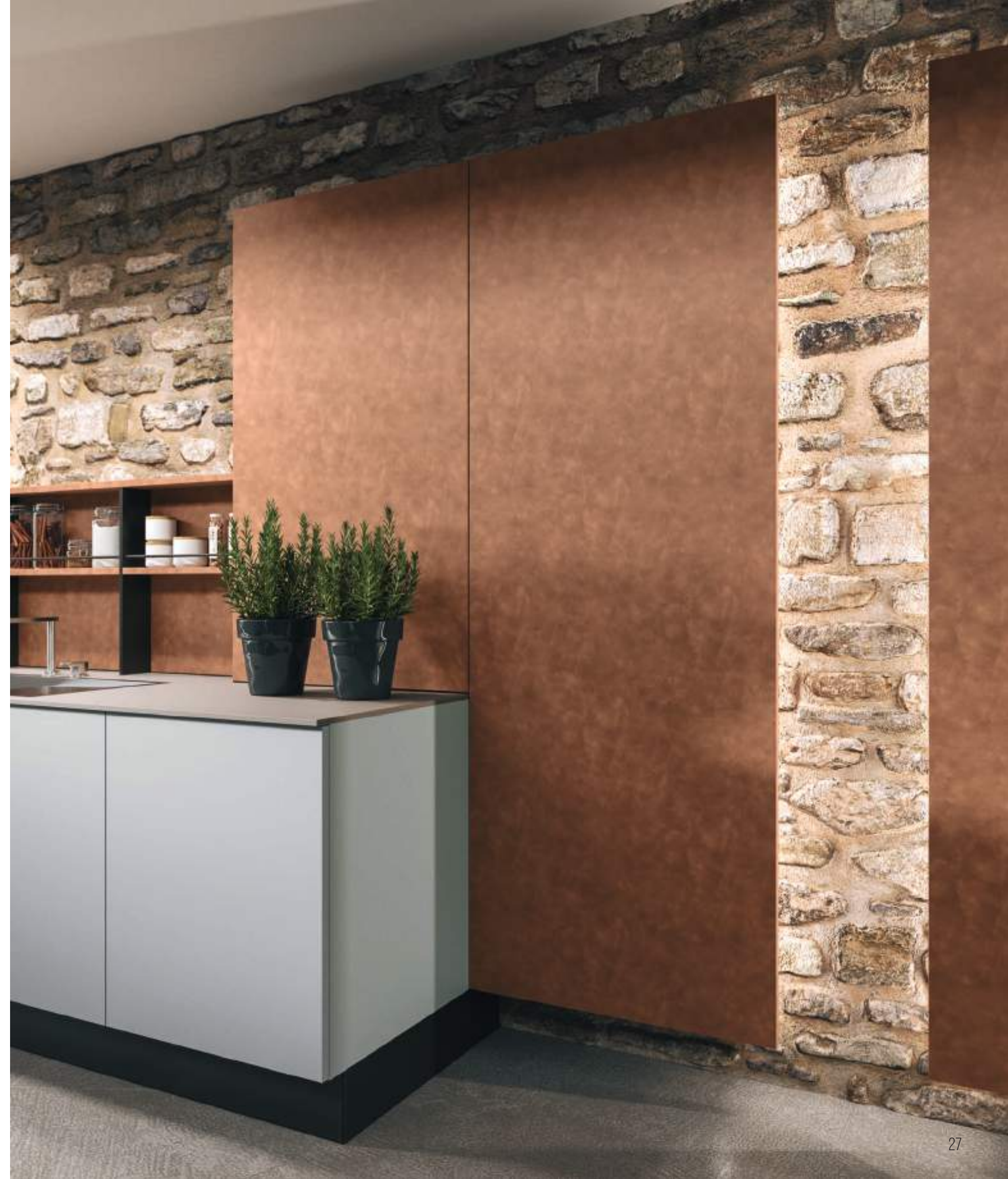
ШКАФЫ И СТЕНОВЫЕ ПАНЕЛИ BROWN LARCH.